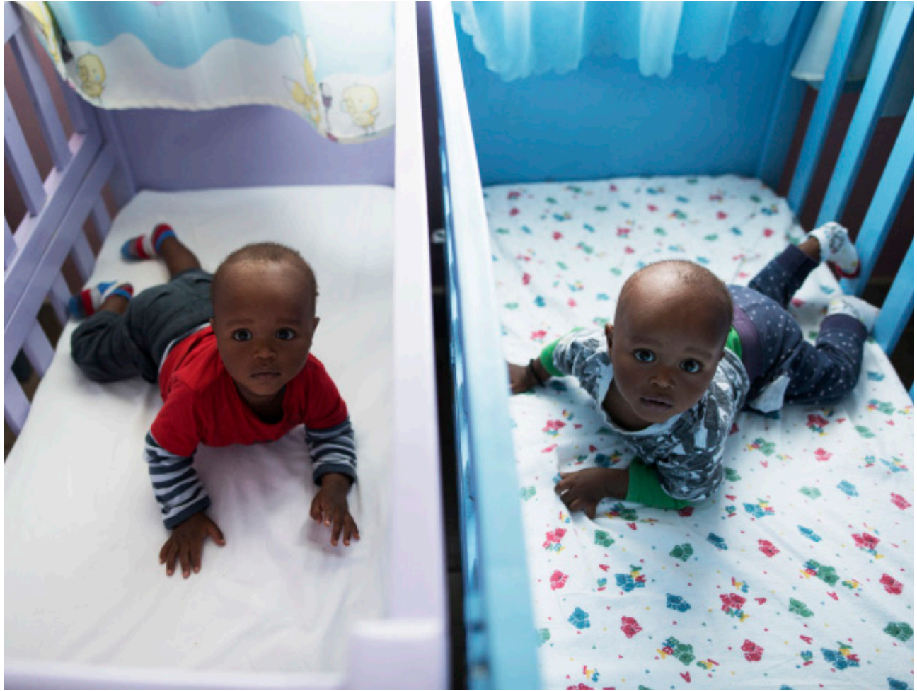
BIJ DE FOTO: KINDEREN EN ZORGVERLEENERS VAN MACHEO IN DE COMPOUND